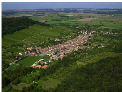
Ce plan local d'urbanisme intercommunal va fixer les règles d'aménagement des 42 communes de la CC2T pour les 10 à 15 ans à venir.

Oui, c'est obligatoire. Mais nous faisons plus en associant les citoyens au travers de différents ren-