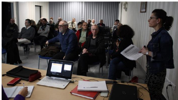
La technicienne du cabinet Espaces et Territoires explique le relevé de terrain.