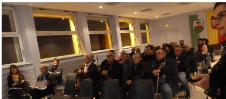
Le public a suivi avec intérêt les informations sur le futur de leur territoire.

Dans le cadre de l'élaboration du Plan Local d'Urbanisme intercommunal (PLUi), la Communauté de Communes Terres Toulaises organise quatre réunions publiques.