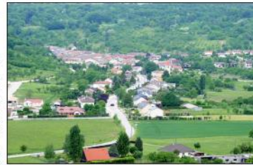
Les permanences au sujet du PLUiH se poursuivront cette semaine, et concernent tout le monde.

Il s'agit de parler à la rencontre des élus de la CC2T (communauté de communes Terres Toulloises) et du bureau d'études en charge du dossier, pour vous informer des avancées du projet de plan de zonage et du règlement qui déterminent les possibilités de constructions et les règles de construction.