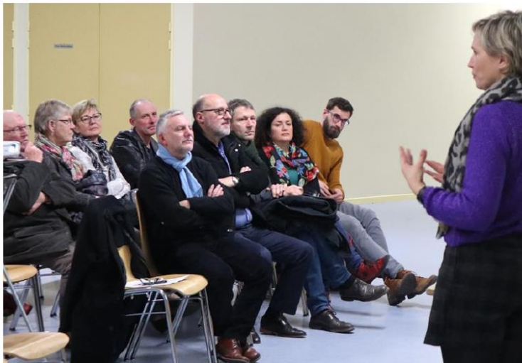
Un débat animé.

Trois thèmes étudiés, la planification, la protection et la gestion. Il y est question du développement urbain, de planification des projets d'infrastructure, de préservation de l'espace naturel et agricole. Avec ses côtes, son vi-